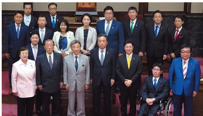
私たちは名古屋民主市議団です

私たち名古屋民主市議団は、地域活動を通じて いただいた皆様の声を集約し、政策提言として取り まとめた「平成31年度 予算要望書」を名古屋市長 に提出しました。