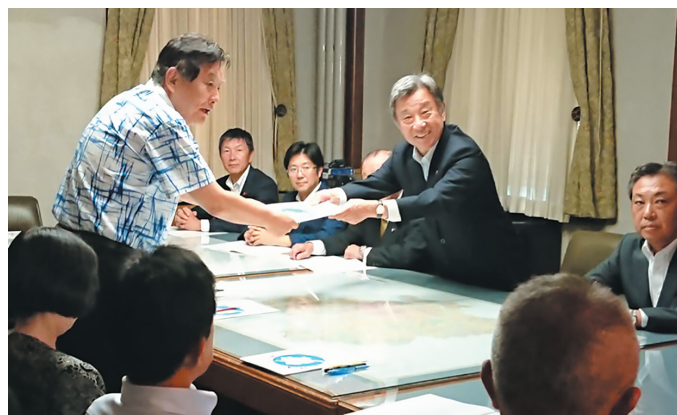
平成31年度予算要望提出 2018年9月14日